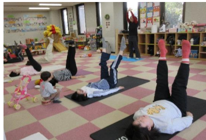
ピラティスで身体スッキリ！

ペットボトルキャップ(洗ってください)・使用済みの切手・プルタブの回収をしています。回収したペットボトルキャップ・使用済み切手・書き損じはがきは世界の子どもたちにワクチンに、プルタブは車椅子になります。ご協力お願いいたします。